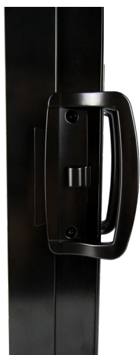
Poignées décoratives ultrarésistantes sur les quatre panneaux