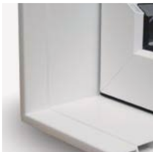
Cadre 5 3/4"