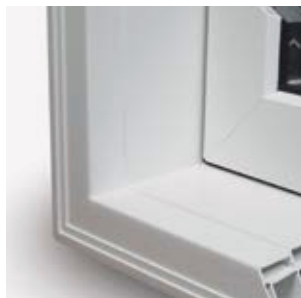
Cadre 5 3/4" incluant une moulure à brique intégrée