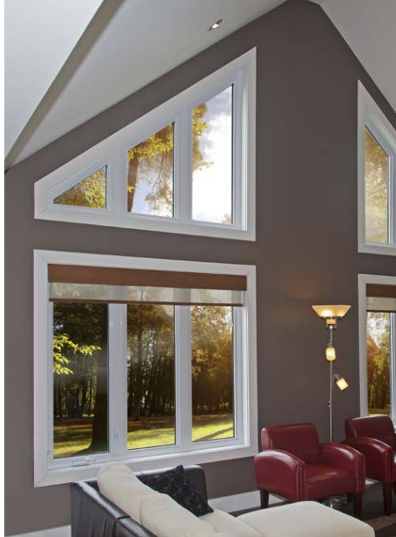
Fenêtres architecturales également disponibles.