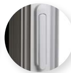
Barrure multipoint Nova Slim