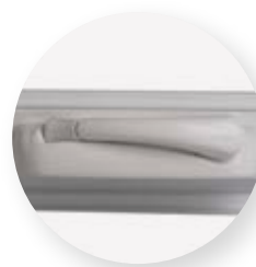
Poignées repliables style Encore